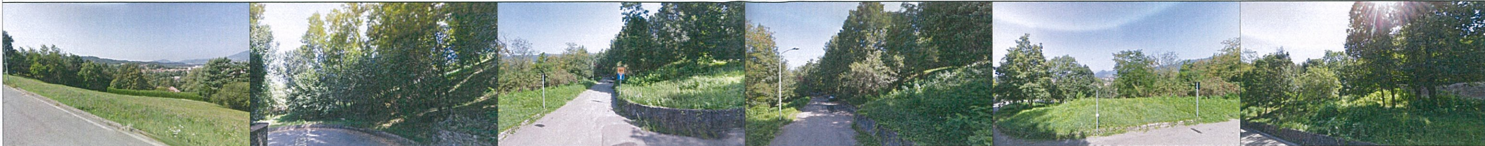
Strada di lottizzazione esistente, che divide il lotto alto dal lotto basso