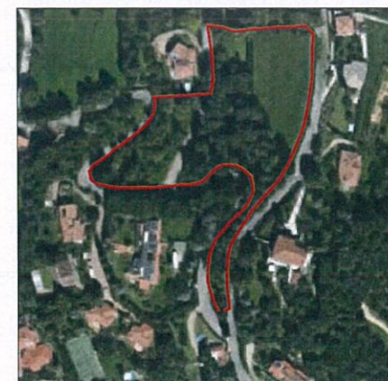
Ortofotografia. In evidenza: area AT8.