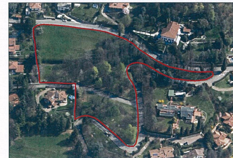
Ortofotografia. In evidenza, l'area compresa nell'AT8.